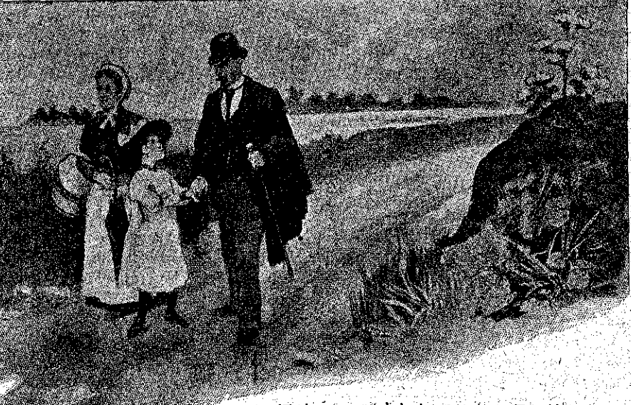
Ἐπήγαμε πεζοὶ ἀπὸ τὸν σταθμὸν. (Σελ. 41, στ. α'.)